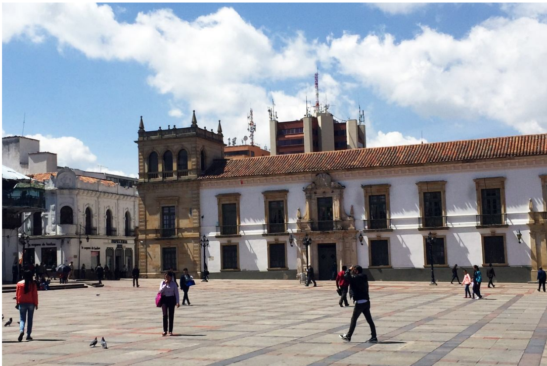
Tunja, capital del departamento de Boyacá, Colombia: sede del Primer Congreso Panhispánico de Geografía y del XXII Congreso Colombiano de Geografía. En esta ciudad está situado el campus central de la Universidad Pedagógica y Tecnológica de Colombia (UPTC), institución anfitriona del evento. La imagen recoge parte del Palacio de la Gobernación, sobre el costado norte de la Plaza de Bolívar.