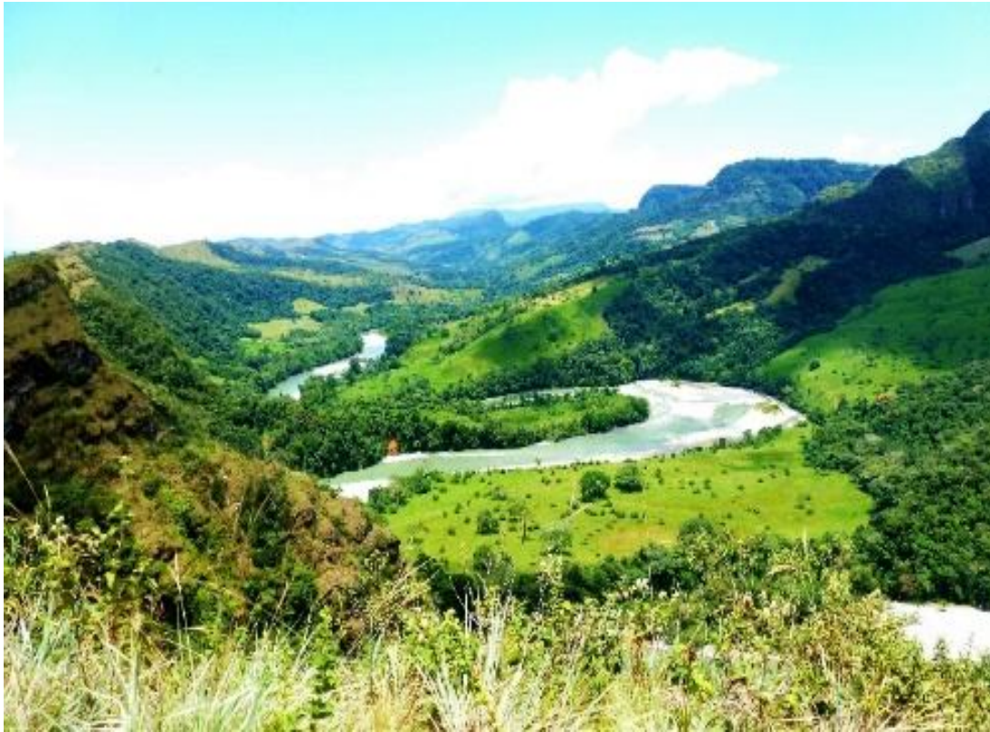
Paisaje de la región oriental colombiana – Cañón del Güejar – hasta donde llegarán los excursionistas al terminar las actividades del CPHG–2017 y del XXII CCG

Julio 31 – Excursión de reconocimiento del sector NE de la Serranía de la Macarena y observaciones del imponente Cañón del Güejar, con posibilidades de baño. Almuerzo. Regreso a Bogotá, haciendo las respectivas paradas para realizar algunas compras. Hora aproximada de llegada a Bogotá: 7:00 p.m.